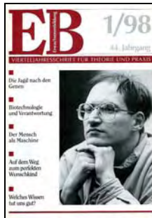
Schöner neuer Mensch