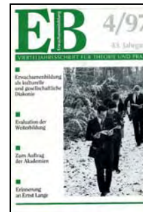
Erwachsenenbildung als kulturelle und gesellschaftliche Diakonie