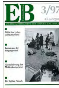
Jüdisches Leben in Deutschland