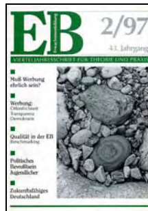
Öffentlichkeitsarbeit - Werbung