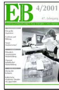
Funktionalisierung von Bildung