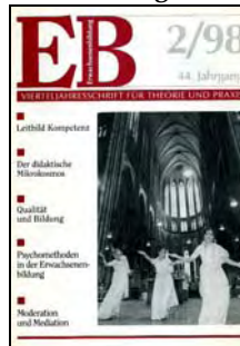
Der didaktische Raum