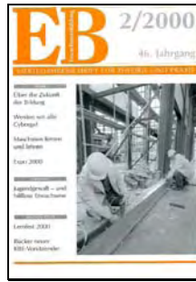
Technik und Bildung